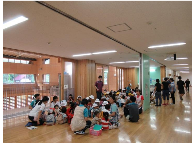
保育所の子どもたちと保護者を待つ児童

保育所、小学校、中学校合同の災害時引き渡し訓練を行いました。いざというときに小学校と中学校のどちらを先に回ってお子さんの引き取りをするのか、だれが引き取るのか、どの程度時間がかかるのか、校庭の出入りは安全かなどいくつも確認することがありました。今回は30分程度で全員の迎えがすみましたが、実際に起こった場合は、自動車が使えず真っ暗になってしまうことも想定されます。次年度以後は、学校が防災拠点としての観点から、地域と一体となった訓練も考えています。