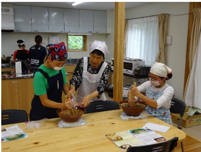
今井さんから郷土料理を教わる児童