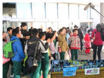
インタビューを受けました