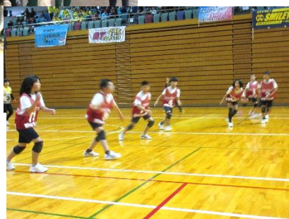
ボールから目を離さないように