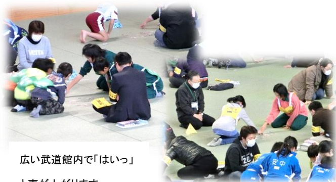
広い武道館内で「はいっ」と声が上がります

です。今年は第70回ということでたくさんの来賓が見えていました。残念ながら予選敗退でしたが、カー杯がんばりました。