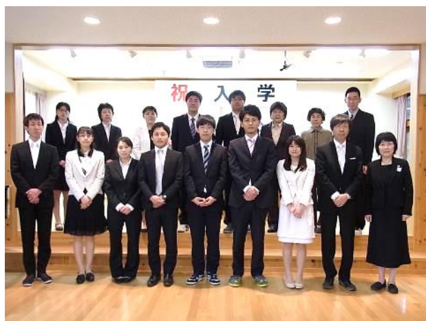
今年度の「チーム上野小」です