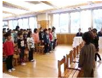
対面して、歓迎の言 葉を聞きます。