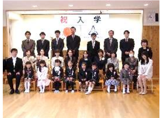
記念写真、ちょっと緊張

教室に戻った1年生は、お巡りさんから交 通安全のお話を聞き、担任の先生と過ごした 後、この日は保護者の皆さんと一緒に帰って きました。