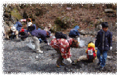
神流町恐竜センター (化石発掘体験)